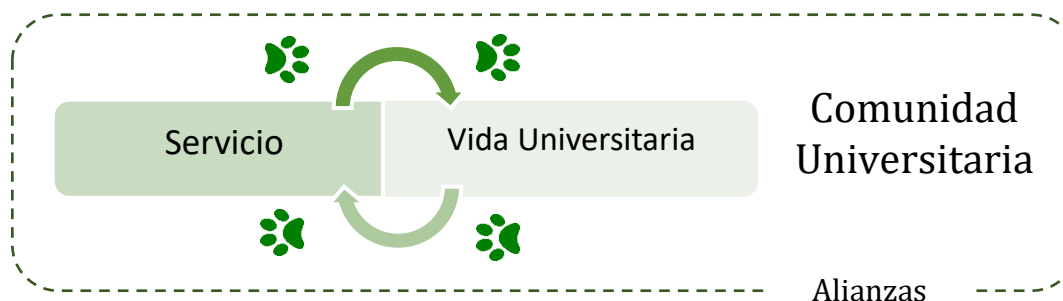
Ilustración 2 Servicio al estudiante impacta la calidad de vida universitaria