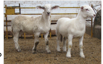
Cordero: ejemplar menor de 8 meses