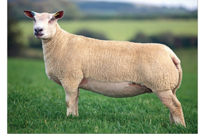
Oveja: Hembra reproductora

Morueco: nombre con que se conoce el carnero u ovino reproductor