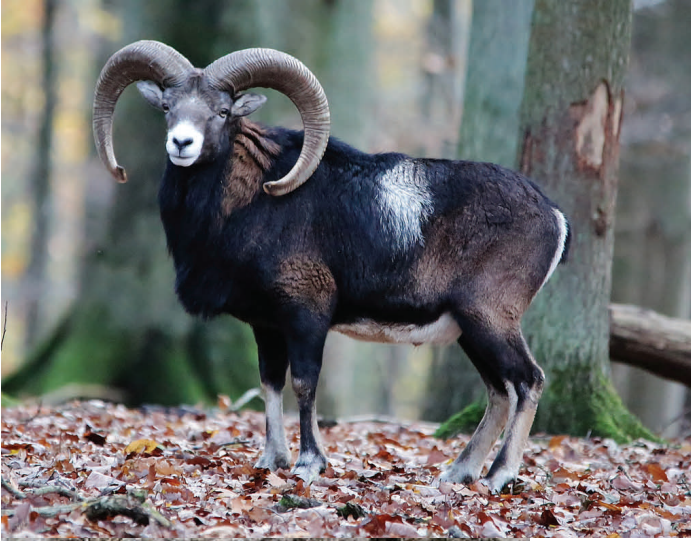
Ovis orientalis musimon

Descendiente de los muflones Europeo ( Ovis orientalis musimon ) y Asiático ( Ovis orientalis orientalis ) los ovinos domésticos son animales del filum Cordata, la clase mamíferos, el orden Artiodáctilo y el sub-orden Ruminantia. Pertenecen a la familia Bovidae y su nombre científico es Ovis aries .