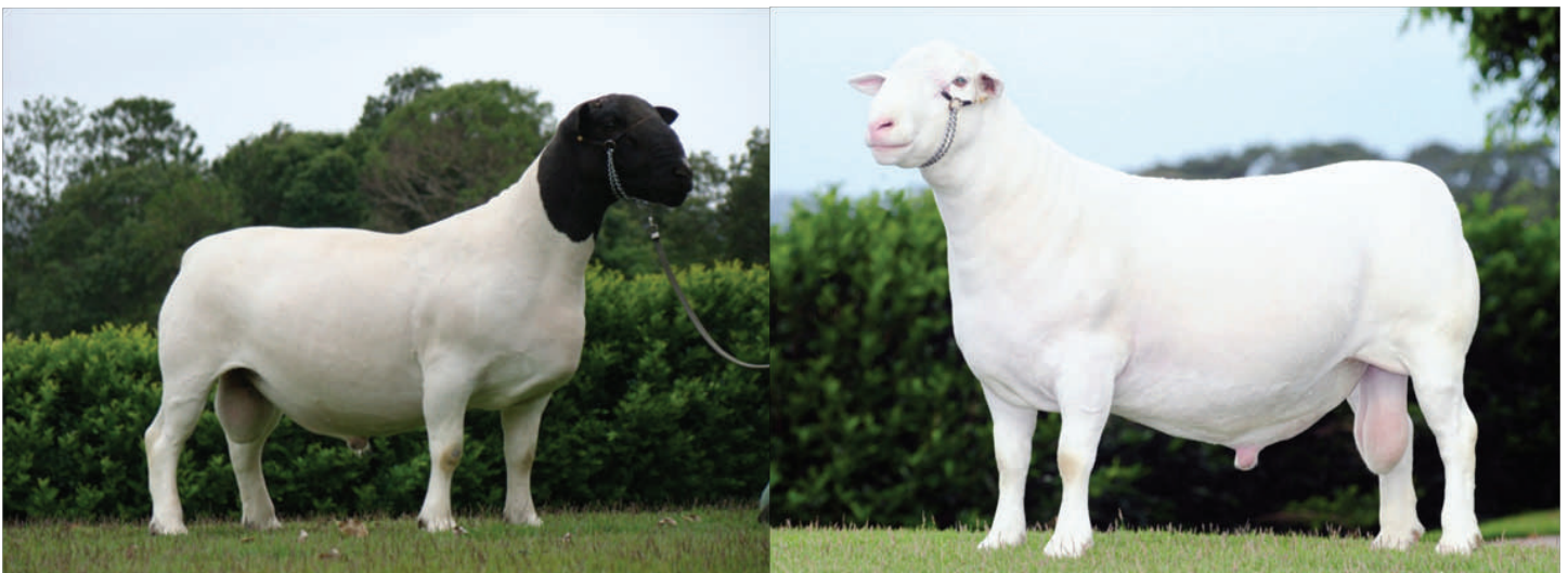
Ejemplares de la raza Dorper cabeza negra y blanca

Raza que se desarrolló en la República de Suráfrica durante los años 30 utilizando cruces de las razas Dorset Horn y Black Head Persian . Tiene un cuerpo de pelo blanco y cabeza negra o son completamente blancos. Es una raza que se adapta a diferentes tipos de clima y sistemas de producción. Tolerante a climas extremos, desde crudos inviernos hasta las altas temperaturas del trópico húmedo o seco. La Dorper es considerada una de las razas ovinas más fértiles en términos reproductivos. Las hembras son de instinto maternal fuerte, con una larga vida productiva y facilidad de parto, logrando excelentes pesos al nacimiento y al destete. Son capaces de pesar 35 kg a los 3 - 4 meses de edad. Los machos presentan una excelente conformación física, con una distribución bien proporcionada y compacta de la musculatura. Cuando son utilizados para producción de carne, el rendimiento de la canal caliente varía de 40 a 48% dependiendo del genotipo y la alimentación. El peso a matanza de los corderos es de 30 a 33 kg a los 100 -130 días de edad. Su carne tiene atributos sensoriales que favorecen la preferencia del consumidor versus carne de otras razas.