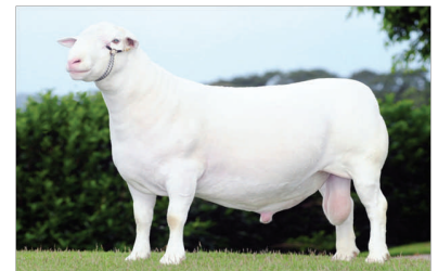
Carnero: macho reproductor