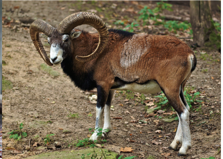
Ovis orientalis orientalis