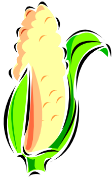
Caption describing picture or graphic.

The most important information is included here on the inside panels. Use these panels to introduce your organization and describe specific products or services. This text should be